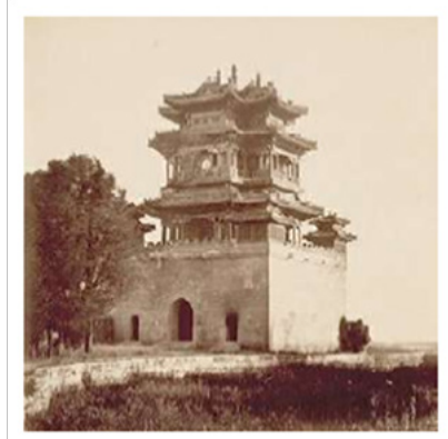
படம் 3.1 ஏகாதிபத்திய சக்திகளின் அழிக்கப்படுவதற்கு முன்பு பழைய கோடை அரண்மனையின் ஒரு பகுதி

அணிவகுத்தார். கிங் அரசின் சார்பில் வெளிநாட்டு வெற்றியாளர்களுடன் பேச்சுவார்த்தை நடத்த முழு அதிகாரம் கொண்ட ஏகாதிபத்திய தூதராக தனது அரை சகோதரர் பிரின்ஸ் கோங் நியமிக்கப்பட்ட பிறகு, கிங் பேரரசர் கூடியன்ஃபெங்க் ஏகாதிபத்திய நீதிமன்றத்தில் ஜெஹொல் வெளியேறினார். ஒரு கொடுமான எல்ஜின் மச்சு வம்சத்தை ஒரு சீனவனுடன் மாற்ற விரும்பினார். மேலும் ஏகாதிபத்திய அரண்மனையை (தடைசெய்யப்பட்ட நகரம் என அழைக்கப்படுகிறார்) பார்க்கலைக் காப்பாற்றுவதற்காக தண்டனையாக எரித்துக்கொள்ள விரும்பினார், ஆனால் பிரஞ்சு மற்றும் ரஷ்ய தூதர்கள் இந்த உடன்படிக்கை உடன்படிக்கைகளை நஞ்சிங். எல்ஜின் ஒரு சமரசம், பெய்ஜிங்கில் இரண்டு ஏகாதிபத்திய தோட்டங்களை அழிக்க தனது படைகளை உத்தரவிட்டார்- இம்பீரியல் கோடை அரண்மனை (கிங்கிய்யுவான்) மற்றும் பழைய கோடை அரண்மனை (யுவான்மிங்யுவான்). ஏகாதிபத்திய சக்திகள் அக்டோபர் 18, 1860 அன்று ராயல் தோட்டங்களை இறுதியாக கலைத்து, அழித்தன. மற்றொரு ஒப்பந்தத்துடன் யுத்தம் முடிவடைந்தது, அக்டோபர் 24, 1860 இல் கையெழுத்திட்ட பெக்கிங் மாநாடு (பெக்கின் முதல் மாநாடு என்றும் அறியப்பட்டது) முடிவுக்கு வந்தது.