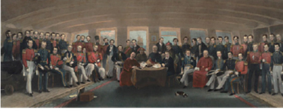
படம் 1.1 நஞ்சிங் உடன்படிக்கை கையொப்பமிடல்