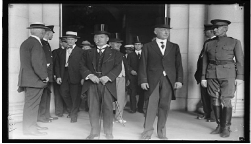
படம் 10.2 லான்சிங்-இஷிஹி ஒப்பந்தத்தில் கையெழுத்திட்ட பிறகு வாஷிங்டன் D.C. இல் ராபர்ட் லான்சிங் மற்றும் இஷிஹி கிகுஜிரோ

போரை தொடர்ந்து இழுத்தபோது, மேற்கத்திய சக்திகளின் நிதி நிலைமை கணிசமாக பலவீனமடைந்தது. நிதிய ஏகாதிபத்தியத்தின் சேனல்கள் மூலம் சீனாவை கட்டுப்படுத்த ஒரு நாடு அமெரிக்கா மற்றும் ஜப்பான் மட்டும்தான். இரு நாடுகளும் சீனாவில் நிதி ஏகபோகத்திற்கான போட்டியை அதிகரித்தன. இரு தரப்பினரும் வாஷிங்டன் D.C. வில் சந்தித்து, நவம்பர் 2, 1917 இல் லான்சிங்-இஷிஹி உடன்படிக்கை என்ற பெயரில் ஒரு ஒப்பந்தத்தில் கையெழுத்திட்டனர். ஒப்பந்தத்தின் படி, இரு நாடுகளும் சீனாவில் திறந்த கதவு கொள்கையை நிலைநிறுத்த உறுதிமொழி அளித்தன. சீனா தனது புவியியல் அருகாமையில் இருப்பதால், ஜப்பானில் ஜப்பானின் 'சிறப்பு நலன்களை' ஒப்புக் கொண்டது. இது, திறந்த கதவு கொள்கைக்கு முரணாக இருந்தது. பொது ஒப்பந்தத்தில் ஒரு இரகசிய நெறிமுறை இணைக்கப்பட்டுள்ளது. முதல் உலகப் போரில் மற்ற நாடுகளைத் தக்கவைத்துக்கொள்வதைப் பயன்படுத்தி ஜப்பானும், அமெரிக்காவும் சிறப்பு உரிமைகள் அல்லது சலுகைகள் பெற விரும்பவில்லை என்று ரகசிய நெறிமுறை கூறியது. சீனாவில் ஜப்பான்ஸ்-அமெரிக்க போட்டியின் வதந்திகளையும், அவர்களுக்கு இடையே நட்பான உறவுகளின் ஆதாரமாகவும் இந்த ஒப்பந்தம் அறிவிக்கப்பட்டது. ஜப்பான், இந்த ஒப்பந்தம் பெரிய இராஜதந்திர வெற்றியாக இருந்தது, ஏனெனில் ஜப்பான் சீனாவில் சிறப்பு நலன்களைக் கொண்டுள்ளதாக அமெரிக்கா ஒப்புக்கொண்டது.