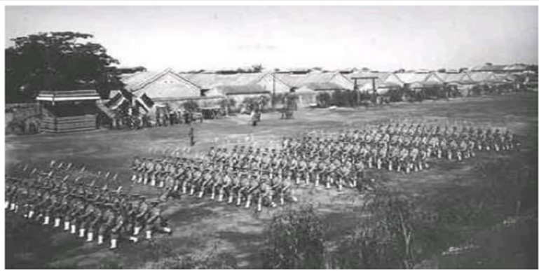
படம் 12.3 பீயங் ராணுவம்

ஆரம்பத்தில், யுவான் ஷிகாய் மற்றும் யுவன் ஷிகாயின் பீயங் இராணுவத்தின் உடைந்த தளபதிகள் ஆகியோரை எதிர்த்த தென் மாகாணங்களின் போர்க்குணமிக்க இரண்டு பெரிய குழுக்கள் இருந்தன. இரு குழுக்கள் யுவான் மரணம் தொடங்கி இரண்டு ஆண்டுகளுக்குள் பிராந்திய விரிவாக்கத்திற்கு போராடியது. பியாங் இராணுவம் மேலும் இரண்டு பிரிவுகளாக பிரிக்கப்பட்டிருக்கிறது, அன்ஹூய் கிளிக்கு மற்றும் சில்லி கிளைக். இரு குழுக்களும் பெய்ஜிங் மீது கட்டுப்பாட்டைப் போராடின. அன்ஹூய் மற்றும் சில்லி கிளைகள் தவிர, வட சீனாவில் மற்ற போர்வீரர்கள் இருந்தனர். ஃபெங்டியன் கிளைக் ஒரு பெரிய கிளைமாக இருந்தது. தெற்குப் போர்வீரர்களும் அடிக்கடி பிராந்திய கட்டுப்பாட்டிற்குள் தங்களுக்குள் போராடினார்கள். தெற்கு சீனாவின் முக்கிய கிளைகளான யுன்னன் குளிக், பழைய குவாங்ஸி கிளைக், நியூ குவாங்ஸி கிளிக்கு மற்றும் சிச்சுவான் குளிக் ஆகியவை அடங்கும். சுயநல காரணங்களுக்காக, வெளிநாட்டு ஏகாதிபத்திய சக்திகள் பெரும்பாலும் ஒரு போர்க்குணமிக்கோ அல்லது இன்னொருவரை ஆதரிக்கின்றன.