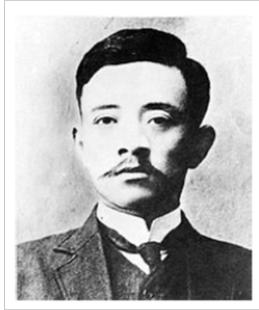
படம் 12.2 படல் ஜியோர்ரன்