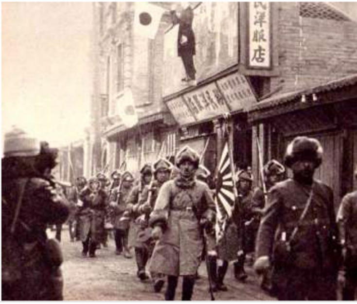
படம் 12.6 ஜப்பானிய படையினர் 1931 இல் மஞ்சூரியாவில் ஒரு நகரத்தில் நுழைந்தன

ஏற்றார். ஜியாங் ஜேசிக்கு விசுவாசம் இருப்பதாக ஜாங் ஜூய்யுயியாங் வடநாட்டு பயணத்தின்போது உறுதியளித்தார். தேசியவாத அரசாங்கத்துடனான ஜாங் ஜியுயுயிங் கூட்டு ஜப்பானுக்கு மிகவும் கவலையாக இருந்தது. ஒரு தீவிரமான நடவடிக்கையில், 1931 ல் ஜப்பான் மஞ்சூரியா மீது படையெடுத்தது. ஜப்பானிய ஆக்கிரமிப்பிற்கு எதிராக தேசியவாதக் கட்சியின் பற்றாக்குறையால் சாங் ஜியுயியாங் ஏமாற்றமடைந்தார். டிசம்பர் 1936 இல், ஜியாங் கம்யூனிஸ்டுகளை கண்காணிப்பதற்காக சியானுக்கு பயணித்தார். இந்த பயணத்தின்போது ஷாங்க் ஜூய்யுயியாங் அவருக்கு உதவினார். இருப்பினும், டிசம்பர் 12 ம் தேதி அவர்கள் சியானை அடைந்தபோது, ஜாங் ஜியானை கைது செய்ததோடு மன்சூரியாவில் ஜப்பானிய படையெடுப்பாளர்களுக்கு எதிராக ஜியாங் நடவடிக்கை எடுக்க வேண்டும் என்று கோரியிருந்தார். இந்த சம்பவம் ஜியான் Incident (ஜியான் ஷிபேய்ன்) என அழைக்கப்படுகிறது. ஜுவான் டிசம்பர் 25, 1936 இல் மன்சூரியாவில் தங்கள் ஆக்கிரமிப்புக்காக ஜப்பானுக்கு எதிராக நடவடிக்கை எடுக்க ஒப்புக் கொண்டார்.