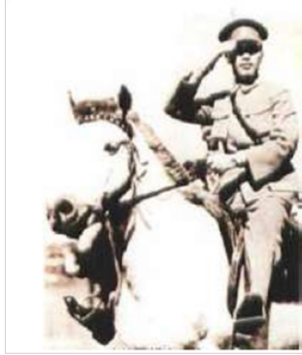
படம். 12.4 ஜியாங் ஜேசி 1926 இல் வடக்கு படையெடுப்பைக் கட்டளையிட்டார்

சுமார் ஒன்பது மாதங்களுக்குள் தேசியப் புரட்சி இராணுவம் சீனாவின் பாதி பகுதியை கைப்பற்றியது. பிரச்சாரத்தில் பின்பற்றப்பட்ட புத்திசால்லித்தனமான உத்திகள் காரணமாக போர்வீரர்களின் விரைவான நீக்கம் சாத்தியமானது. தேசியப் புரட்சி இராணுவம் ஒவ்வொரு இராணுவ நடவடிக்கைக்கும் முன்னதாக விவசாயிகள் மற்றும் உள்ளூர் போர்வீரர்களின் இராணுவத்தில் பரந்த பிரச்சாரத்தை மேற்கொண்டது, அதன் காரணத்திற்காக மக்கள் ஆதரவை அணிதிரட்டியது. இதன் விளைவாக தேசிய புரட்சிகர இராணுவத்திற்கு கணிசமான எண்ணிக்கையில் போர்வீர் படைகள் மாறிவிட்டன. இது தேசிய புரட்சிகர இராணுவத்தை வலுப்படுத்தியதுடன், யுத்தக் குழுக்களை பலவீனப்படுத்தியது.