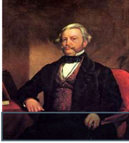
படம் 4.2 1855 இல் டவுன்சென்ட் ஹாரிஸின் ஓவியம்