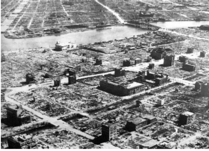
படம் 14.3 மார்ச் 14, 1945 அன்று குண்டு வீசிக்குப் பின்னர் டோக்கியோ நகரம்