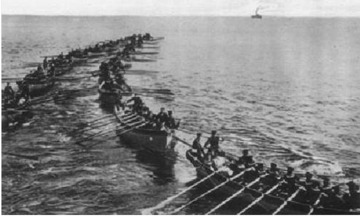
படம் 10.1 முதல் உலகப் போரின் போது க்யின்டோவ், சீனாவில் இறங்கும் ஜப்பானிய படையினர்