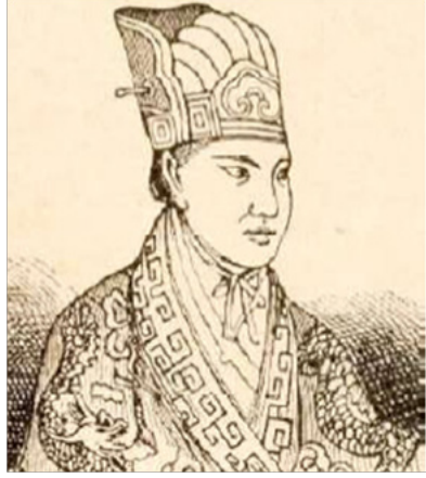
படம். 2.1 ஹாங் சியுக்வான்

1844 இல், ஹாங் அருகிலுள்ள குவாங்சி மாகாணத்திற்கு நகர்ந்தார் மேலும், கிறிஸ்தவத்தைப் பிரசங்கிக்க ஆரம்பித்தார். அவரது கூட்டாளிகளில் ஒருவர், ஃபெங் யுன்ஷான் ஹாங்கின் புரட்சிகர கருத்தாக்கங்களை பரப்புவதற்கு அங்கு கடவுள் வழிபாட்டாளர்களின் சமூகம் (பாய் ஷங்கிடி ஹூய்) என்ற மத அமைப்பை நிறுவினார். ஹாங் மற்றும் அவரது மூன்று நண்பர்களான ஃபெங் யுன்ஷான், யங் ஜியுகிங் மற்றும் சியாவோ சாஜூயி ஆகியோர் சங்கத்தின் முக்கிய நபர்களாக இருந்தனர். 1847-ல், ஹாங் சமூகத்தின் உயர்ந்த தலைவராக அறிவிக்கப்பட்டார். ஃபெங்,