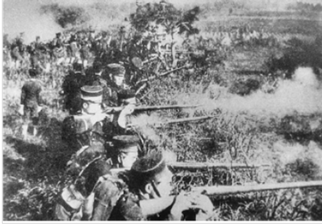
படம். 6.1 முதல் சினோ-ஜப்பானிய போரில் ஜப்பானிய படைகள்

முதல் சினோ-ஜப்பானிய போர் கொரியா மீது போரிட்டது. 1885 ஆம் ஆண்டு தியான்ஜின் உடன்படிக்கைக்குப் பிறகு, கொரியா மீது ஜப்பானின் அரசியல் மற்றும் இராணுவ செல்வாக்கு குறைவாகவே இருந்தது, ஆனால் அதன் பொருளாதார செல்வாக்கு மிகவும் வலுவாகியது. கொரியாவின் வெளிநாட்டு வர்த்தகத்தில் கிட்டத்தட்ட தொண்ணூறு சதவீதம் ஜப்பான் இருந்தது. கொரியா மீதான ஜப்பானிய பொருளாதார செல்வாக்கைக் கட்டுப்படுத்த அனைத்து முயற்சிகளையும் லி ஹொங்ஹாங் செய்தார், மேலும் கொரியாவில் சீன இராணுவ அதிகாரிகளின் இருப்பை அதிகரித்தார்.