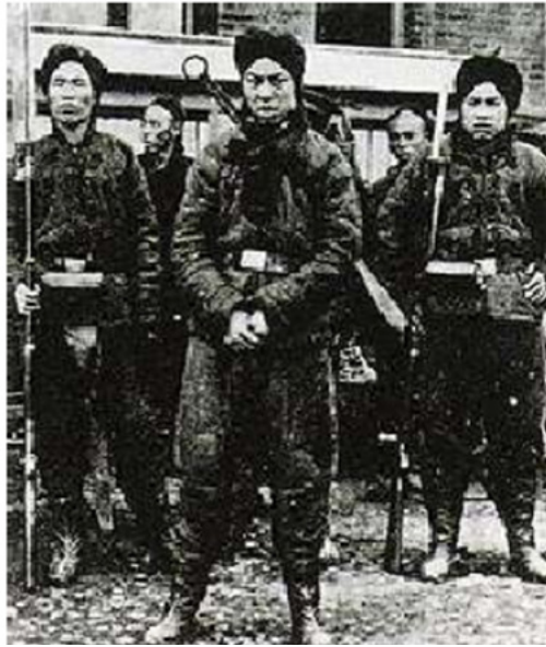
படம் 7.1 பாக்ஸர் போராளிகள்

இப்போது குயிங் யிஹ்டுவானின் புதிய போர் குரல் 'குயிங் ஆதரவளி, அந்நியர்களை அழியுங்கள்.' பாக்ஸருக்கு எந்த மையப்படுத்தப்பட்ட தலைமையும் இல்லை. அதற்கு பதிலாக, அவர்கள் தங்கள் தேசியவாத ஆவி மற்றும் ஆழமான பொருளாதார ஏமாற்றத்தை தங்களது இராணுவத்தை கட்டியெழுப்பினர். அடிப்படை பிரிவு ஆண்கள் மற்றும் பெண்கள் இருவரும் கொண்டிருந்தது. இளம் மற்றும் நடுத்தர வயதான பெண்கள் தனி பிரிவுகளை உருவாக்கினர். இளம் பெண்களின் பிரிவு சிவப்பு விளக்குகள் என அழைக்கப்பட்டது, மற்றும் வயதான பெண்கள் அலகு நீல விளக்குகள் என அழைக்கப்பட்டது, இரு பிரிவுகளின் உறுப்பினர்கள் முறையே சிவப்பு மற்றும் நீல விளக்குகளை வைத்திருந்தனர். போரில், பத்து வீரர்கள் குழுவை உருவாக்கி, பத்து படைகள் ஒரு படைப்பிரிவை உருவாக்கியது. இதில் அணி தலைவர்கள் மற்றும் படை தலைவர்கள் இருந்தன, ஆனால் எதிர்காலத்திற்கான எந்தவொரு வரைபடமும் இல்லை. அரசாங்க ஆதரவுடன், பாகிஸ்தானியர்கள் சீனாவிலிருந்து வெளிநாட்டவர்களை வெளியேற்றுவதற்கு முற்றிலும் தங்களை ஈடுபடுத்திக் கொண்டனர்.