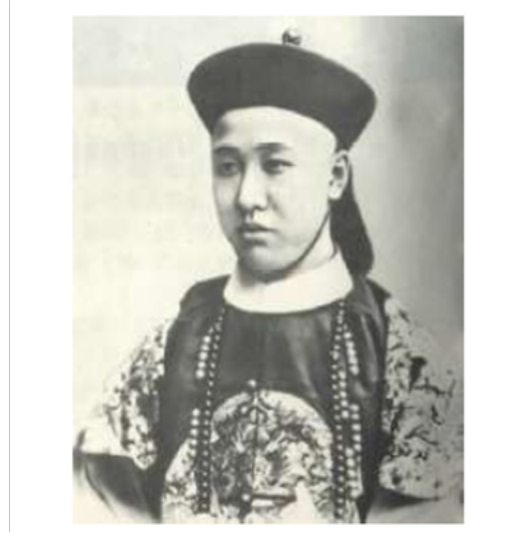
படம் 7.4 இளவரசன் சன்