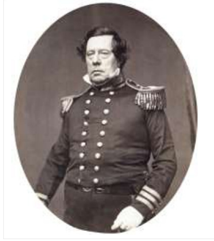
படம் 4.1 கமாண்டோர் பெர்ரி