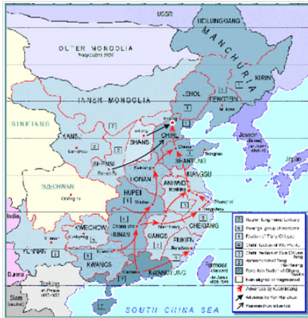
படம் 12.5 வடக்கு பயணம் 1926-27