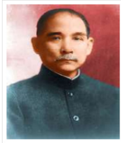
படம் 12.1 சன் இன்னே சென்

சன் யட்-சென் பின்னணியைப் பயன்படுத்தி அதன் நன்மை மற்றும் தீமைகளைக் கொண்டது. அவர் சாதாரணமாக இருந்ததால், மேற்கத்திய பாணியிலான மருத்துவர் மற்றும் ஒரு கிரிஸ்துவர், லியாங் கிச்சோ மற்றும் காங் யுவீய் போன்ற அறிஞர் அதிகாரிகள் அவரைப் பற்றி பயந்தனர். சன் அவர்களுக்கு ஒரு சாதாரண கலக்காரனாக இருந்தார், அவருடன் சேரும் ஒரு அறிஞராக அல்ல. இருப்பினும், சன் விவசாய வர்க்கத்திற்குச் சொந்தமானவர் மற்றும் வெளிநாட்டு சீனர்களிடையே வாழ்ந்து வந்ததால், சாதாரண சீன விவசாயிகள் அவருடன் எளிதில் இணைந்திருக்கலாம், கன்பூசியஸ் அறிஞர்கள் குறைபட்டுள்ளனர்.