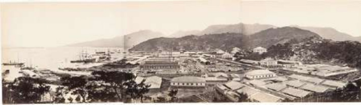
படம் 7.2 ஃபூஹூ ஆர்சனாலில் கீழ் கட்டுமானம் (சுமார் 1867)

இயக்கத்தை மூன்று கட்டங்களாக பிரிக்கலாம். முதல் கட்டம் 1861 முதல் 1872 வரை நீடித்தது. இரண்டாம் கட்டமானது 1872 முதல் 1885 வரை நீடித்தது. மூன்றாவது மற்றும் கடைசி கட்டமானது 1885 முதல் 1895 வரை நீடித்தது. முதல் கட்டம் மேற்கத்திய பாணி ஆயுதங்கள் மற்றும் பிற இராணுவ தொடர்புடைய நிறுவனங்களை அமைப்பதில் கவனம் செலுத்தியது. முதல் கட்டத்திற்கான முழுக்கம் 'சுய வலுப்படுத்துதல்' (ஜிகியாங்). சீனாவின் ஒப்பீட்டளவில் உறுதியான வெளிநாட்டு உறவுகள் 1870 ஆம் ஆண்டில் தியானிங்கில் ஒரு கலவரத்தில் பல பிரெஞ்சு மற்றும் ரஷ்ய குடிமக்கள் கொல்லப்பட்டபோது திகைத்தனர். மேற்கத்திய நாடுகளுடனான உறவுகளின் புத்துயிர் இயக்கத்தின் முதல் கட்டத்தின் முடிவைக் குறிக்கின்றது. இரண்டாவது கட்டத்தின்போது, நாட்டை வலுப்படுத்தும் பொருட்டு செல்வத்தை உருவாக்குவதில் கவனம் செலுத்தப்பட்டது. அல்லாத தொழில் துறைகளை அமைக்க வலியுறுத்தல் இருந்தது. முழுக்கம் 'செல்வமும் சக்தியும்' (ஃபுகுங்) ஆகும். மூன்றாம் கட்டம் இளவரசர் கோங் மற்றும் அவரது ஆதரவாளர்கள் 1884 ஆம் ஆண்டில் பேரரசர் டோவஜெர் சீக்னி தலைமையிலான பழமைவாத பிரிவினால் ஓரளவிற்கு பேராசையால் பாதிக்கப்படவில்லை. எனினும், நீதிமன்றம் தொழில்மயமாக்கல் மற்றும் தேசிய பாதுகாப்பு யோசனைக்கு ஆதரவளித்தது. எனவே, தேசிய கட்டிட வேலைகள் தொடர்ந்தது. மூன்றாவது கட்டம் கடற்படை மற்றும் மேற்கத்திய பாணியிலான இரும்பு மற்றும் எஃகு வேலைகளை கட்டமைப்பதில் கவனம் செலுத்துகிறது.